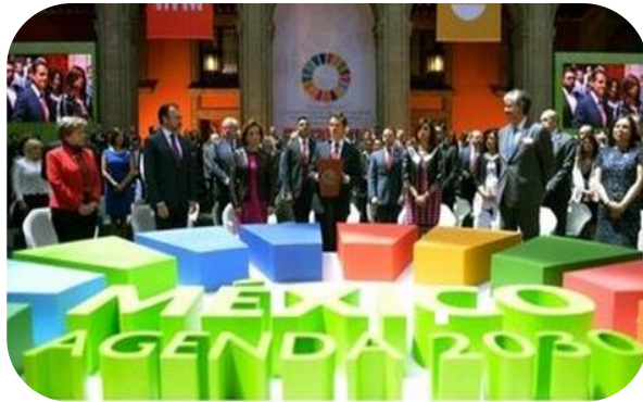
Consejo Nacional de la Agenda 2030